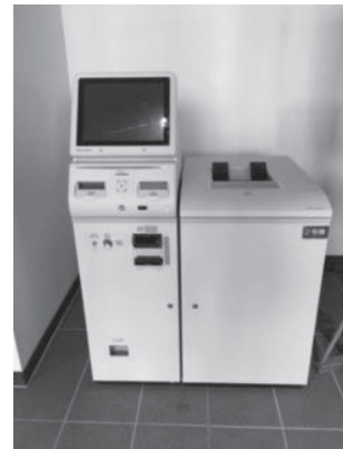
良心館 1階 証明書自動発行機

在学証明書、成績証明書等の証明書が必要なときは、良心館1階にある証明書自動発行機で発行が可能です。発行の際は、学生証とパスワードが必要です。